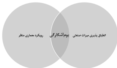
شکل ۴. مدل مفهومی انطباق‌پذیری میراث صنعتی با رویکرد منظر (Author, 2022)

بوم‌آشکارگی متناظرترین رویکرد با انطباق‌پذیری استفاده مجدد میراث صنعتی با رویکرد منظر است و می‌توان این مفهوم را در فصل مشترک انطباق‌پذیری و منظر مکان‌یابی کرد. شکل ۴ مدل مفهومی انطباق‌پذیری میراث صنعتی با رویکرد منظر را نشان می‌دهد.