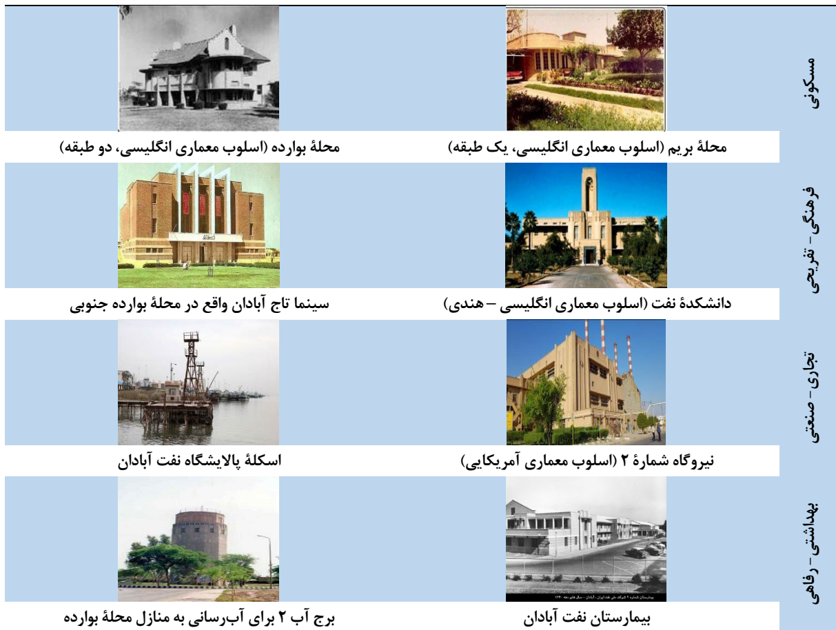
شکل ۱. برخی کاربری‌های ایجادشده به‌واسطه صنعت نفت در آبادان (Author, 2022)